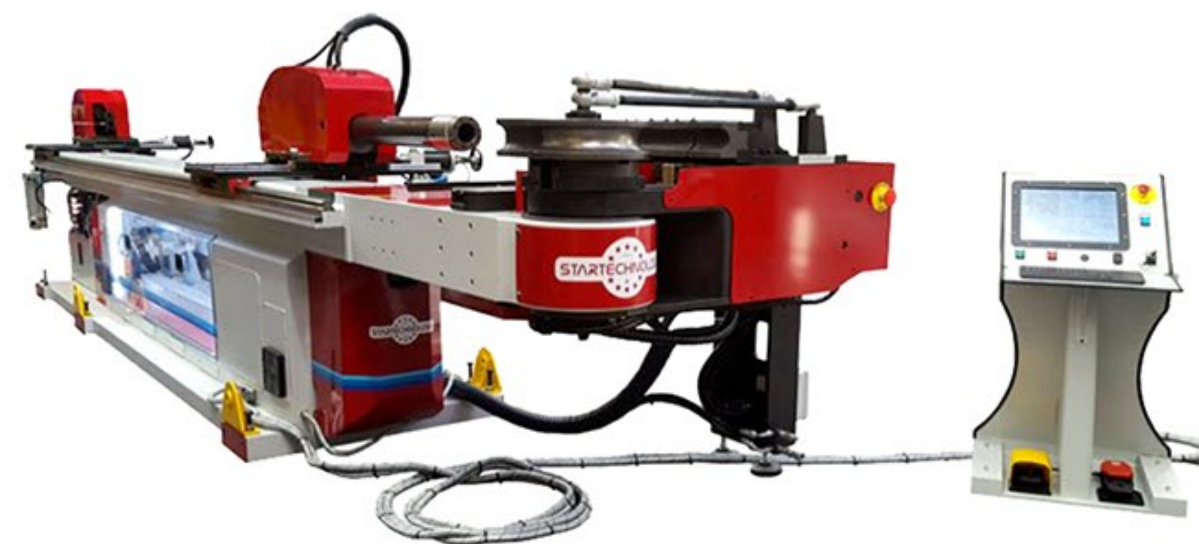
Giętarka trzpieniowa do rur STAR EVOBEND 380 CN3 PNEU