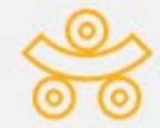
Gięcie rur i profili